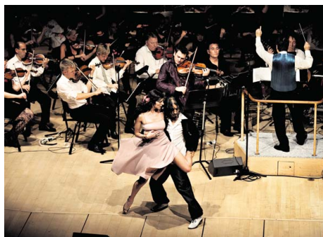
SYMFONISK. Koncert med Sjællands Symfoniorkester alias Copenhagen Phi i 2011. Temaet var tango.

DET SENESTE år har været præget af dramatik for det symfoniske musikliv. Og her tænker jeg ikke på de symfoniske dramaer, der løbende udspringer sig i landets